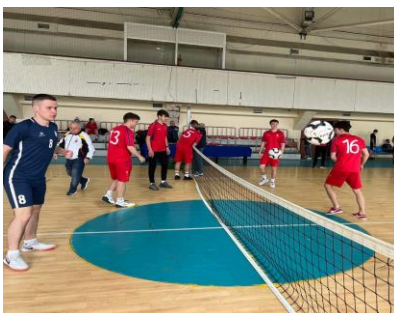
(b) Fotbal – Tenis